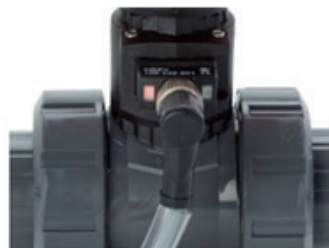
Elektrische Stellungsrückmeldung ("Doppelsensor")