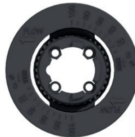
546 Lineare Pro-Rundsкала zur Anzeige des Durchflusses in %