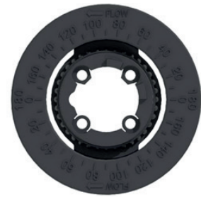
523 Pro Rundsкала zur Anzeige von Öffnungswinkel von 0° bis 180°