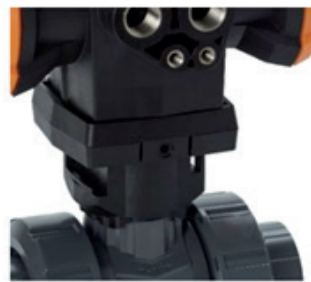
Schnittstelle zur Automatisierung