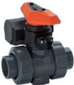
Manuelle Federrückstelleinheit ("Totmann-Hebel")