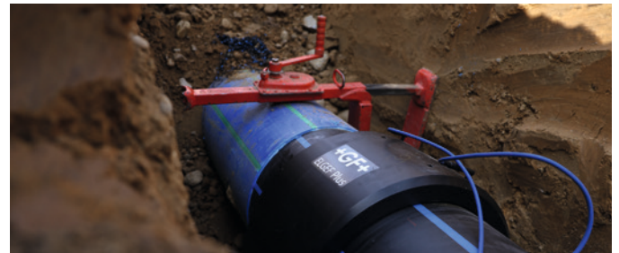
Einfache Installation der grossdimensionierten ELGEF Plus Muffe im engen Graben.

Georg Fischer Piping Systems Ltd Ebnatstrasse 111 8201 Schaffhausen / Schweiz Telefon +41 (0)52 631 11 11 mail@georgfischer.com www.gfps.com