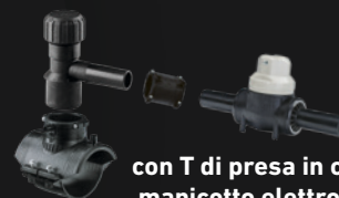
con T di presa in carica, manicotto elettrosaldabile e valvola a sfera