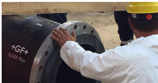
Ajuste perfeito e fácil para reparos em PE: Acoplador ELGEF Plus e flange GF Piping Systems d500 mm.