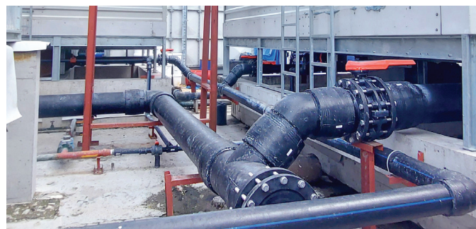
Tubos de PE para aplicação de água de condensador, filial WalterMart Makati

Eles são específicos sobre o uso de materiais de qualidade e instalação, materiais de tubulação leves, e nossa solda por eletrofusão torna a instalação rápida e fácil. A WalterMart também está muito satisfeita com nosso suporte em pós-vendas (treinamentos de soldagem, preocupações com a instalação) e eles têm uma parceria crescente com a GF.